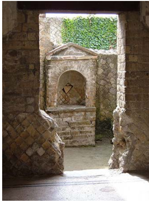
Afbeelding 1. Dit is een altaar in een Romeins woonhuis, waar de goden die het gezin en het huis beschermden werden vereerd. De bewoners legden voedsel en bloemen voor de goden in de ruimte onder de stenen boog. Het huis is nu een ruïne en staat in de Italiaanse stad Herculaneum.